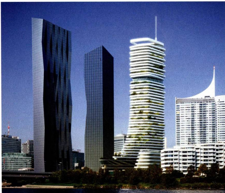
Bis 2023 soll der höchste Wohnturm Österreichs in den Himmel wachsen. Die Danube Flats – der weiße Turm in der Mitte – sollen 160 Meter hoch werden und 600 Apartments beherbergen