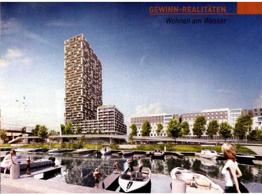
Zwischen Donau und Prater wird derzeit am 130 Meter hohen Marina Tower (rechts) im Zweiten Bezirk gebaut. Geplante Fertigstellung der 500 Wohnungen: Ende 2021

meint Schachinger. Wer sein eigenes Boot vor dem Haus parken möchte, kann auch einen Liegeplatz erstehen. Kostenpunkt: rund 50.000 Euro. Erlaubt sind im Kuchelauer Hafen allerdings nur Segel- oder Elektroboote. Der motorboottaugliche Yachthafen liegt etwa einen Kilometer flussabwärts.