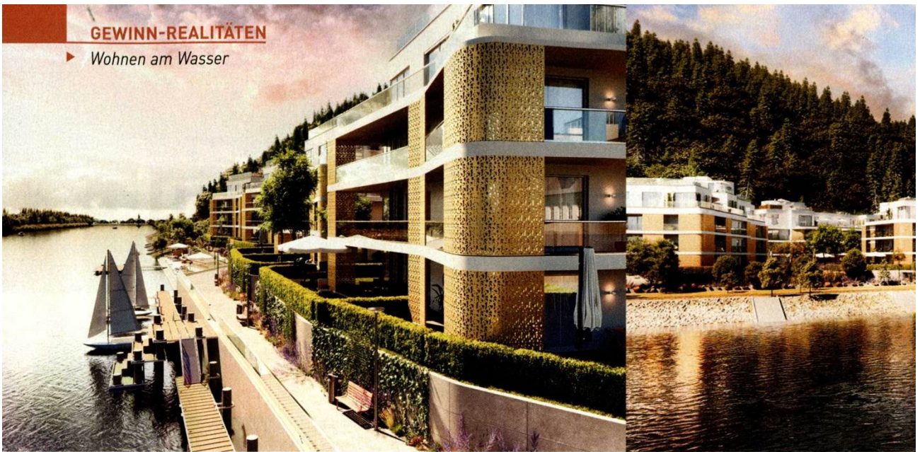
Näher an der Donau geht nicht: Das Projekt The Shore im Kuchelauer Hafen in Döbling punktet mit Privatstrand und eigenen Boots- und Liegeplätzen. Der Baustart für die 125 Wohnungen erfolgt noch heuer. Das günstigste 50-Quadratmeter-Apartment soll 350.000 Euro kosten